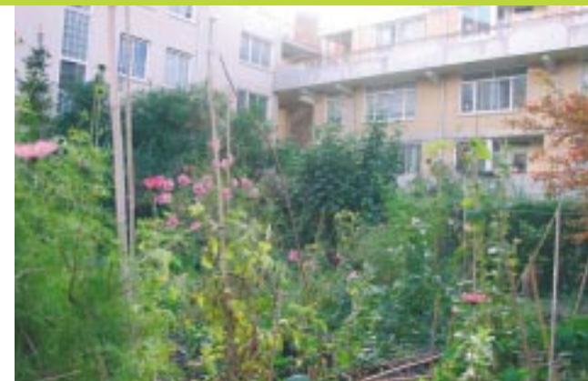
Daktuin in De Pijp

Geef altijd uw mening. Het heeft zin, maar wees wel op tijd! Zorg ervoor dat uw brief binnen de gestelde termijn bij het stadsdeel is. De termijn waarbinnen u kunt reageren, staat in de kennisgeving. Als u niet op tijd reageert, wordt uw mening niet meegewogen. Het niet ontvangen van een stadsdeelkrant is volgens de rechter meestal geen geldig argument om niet op tijd te reageren.