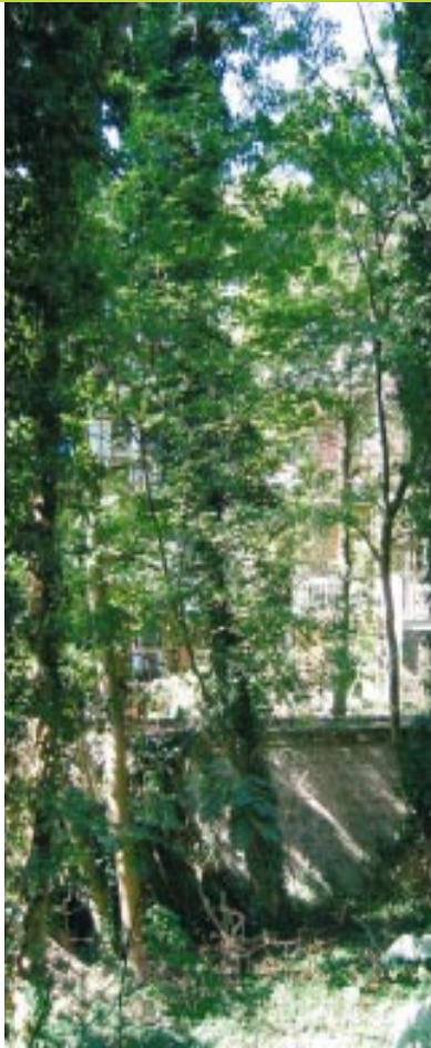
Bomen in tuin in Oud-West

In binnentuinen staan vaak bomen. Als er gebouwd wordt in een binnentuin, moeten bomen soms gekapt worden. Maar kappen mag niet zomaar. In de bomenverordening, de regels over bomen van het stadsdeel, staat wanneer wél en wanneer niet gekapt mag worden. Als een boom een doorsnede van meer dan tien centimeter heeft en 1,3 meter boven maaiveld groeit, moet een kapvergunning worden aangevraagd. Ook hiervoor geldt: u hebt het recht het stadsdeel te laten weten dat u het hier niet mee eens bent. Houd goed in de gaten of er voor bomen in de binnentuin een kapvergunning wordt aangevraagd. Herhaal daarom de stappen twee en drie en eventueel vier.