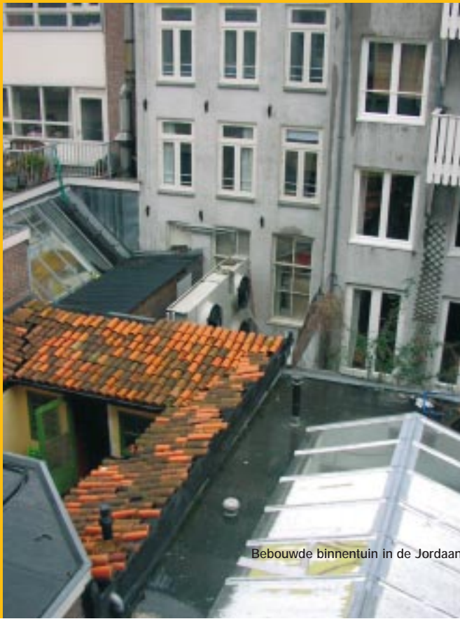
Bebouwde binnentuin in de Jordaan