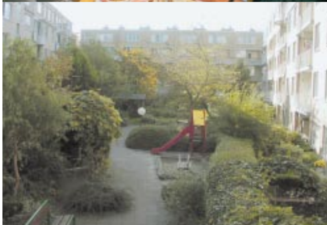
Binnentuin in de 2e Van der Helststraat, in de Pijp